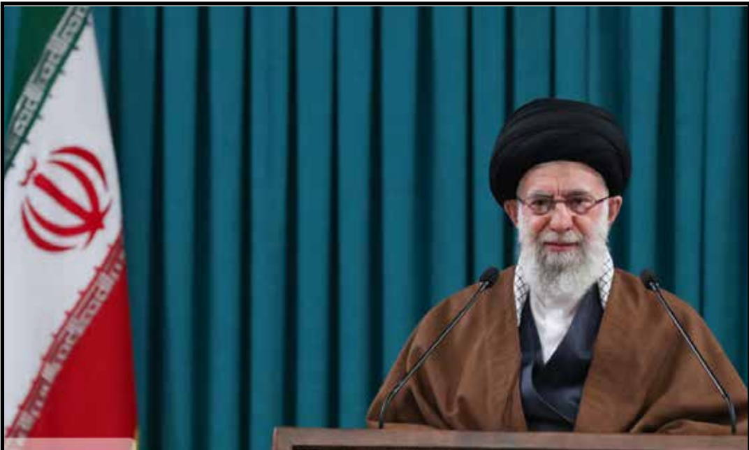
بیانات رهبر معظم انقلاب در روز مبعث نبی اکرم (صلی الله علیه و آله):

دبیر شورای حفظ حقوق بیت المال شهرستان بردسیر ضمن بیان این مطلب که مسئولیت مدیران در حفظ، حراست و نگهداری از اموال عمومی یا بیت المال حساسیت زیادی دارد، گفت: به لحاظ