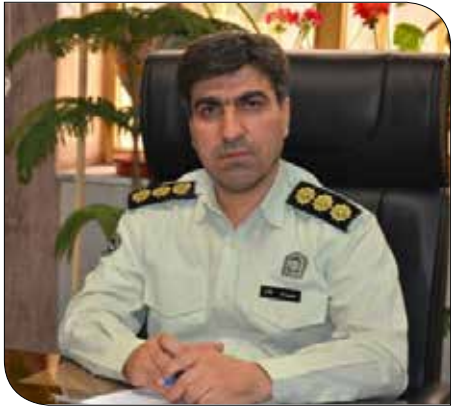
رئیس پلیس آگاهی استان کرمان از انهدام باند ۴ نفره کلاهبرداری از شهروندان با ترغیب فروش

شیخ انصاری فرمود در جریان غدیر، پیامبر (صلی الله علیه و آله و سلم) در برابر صد هزار نفر، علی (علیه السلام) را با صراحت به جانشینی خود برگزید و شما انکار کردید و گفتید غدیر نبوده یا اگر بوده چیز مهمی نبوده است، فقط سفارش به دوستی با علی (علیه السلام) بوده است. اشکال از ما بود که ما عید غدیر خم را با سر و صدا و شعار، بزرگ نداشتیم و این چنین شد، ترسیدیم که اگر عاشورا را هم بزرگ نکنیم، با ما شعار و تظاهر بزرگوار نکنیم، شما انکار کنید و بگویید اصلا حسین (علیه السلام) شهید نشد یا حسین (علیه السلام) را رهازنان میان راه کشتند و یزید (لعنت الله علیه) انسان با تقوایی است منبع صد نکته از هزاران، آیت الله حاج شیخ علی رضائی تهرانی