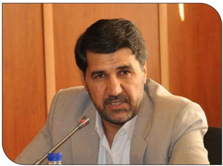
بازرس کل استان کرمان گفت: شیوع اخذ رشوه در رده‌های میانی شهرداری یک هشدار است و شاهد چندین پرونده اختلاس در سطح‌های مختلف در شهرداری‌ها هستیم.

شوراهای اسلامی شهرهای استان کرمان با بیان اینکه کار شهرداران، کار سخت و پرمشغله‌ای است، اظهار داشت: یکی از آسیب‌های جدی که ظهور و بروز آن در شهرداری‌ها بیشتر مشاهده می‌شود، ضعف مدیریت است. وی با اشاره به اینکه عوارض ضعف مدیریت شهری باید شناسایی و برطرف شوند، گفت: ظرفیت بسیار بالایی از مجموعه نیروی انسانی در شهرداری‌ها مشغول به کار هستند که اگر اقتدار مدیریتی در این حوزه وجود نداشته باشد، کار شهرداری با مشکل مواجه می‌شود. بازرس کل استان کرمان یادگستی، رعایت ضوابط و مقررات، نظارت و کنترل زیرمجموعه، حفاظت از نیروی انسانی، استفاده به موقع از ابزارهای