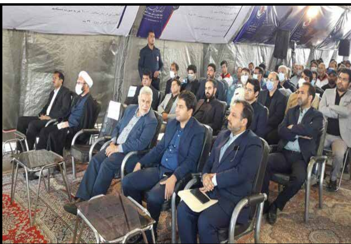
با حضور خاندوزی وزیر اقتصاد: