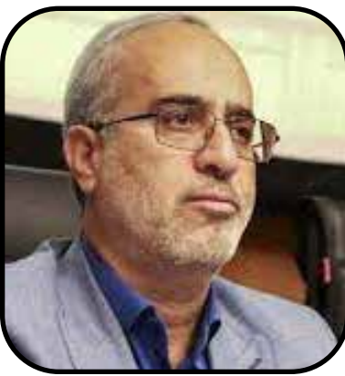
کنیم زیرا یک مجموعه را گرفتار می کنیم

انتقاد استاندار کرمان از عملکرد جزیرهای ادارات تولید یک معدن هفت ماه متوقف مانده است استاندار کرمان گفت: خانواده ها نگران اشتغال فرزندان خود هستند و ما نمی توانیم بین بخشی کار