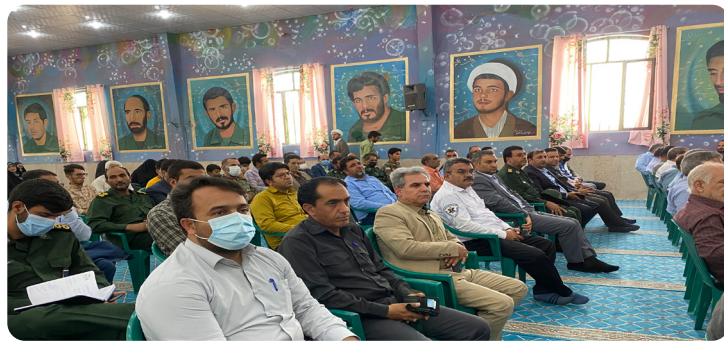
جلسه با مدیریت آموزش و پرورش