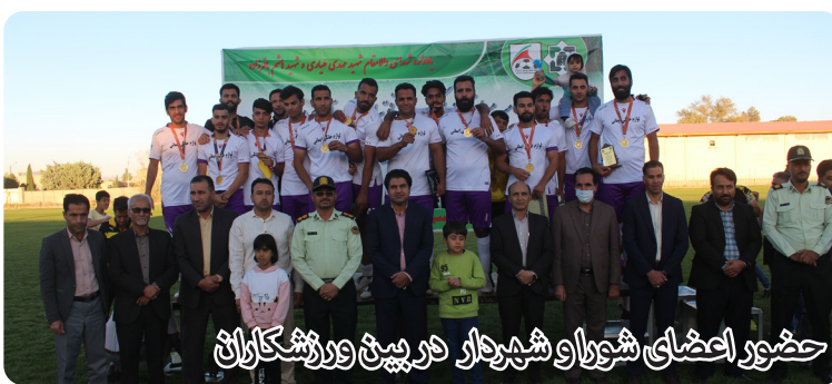
حضور اعضای شورا و شهردار در پیش ورزشکاران