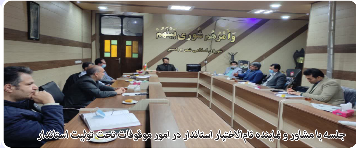
جلسه با مشاور و نماینده تام الاختیار استاندار در امور موقوفات تحت تولیت استاندار