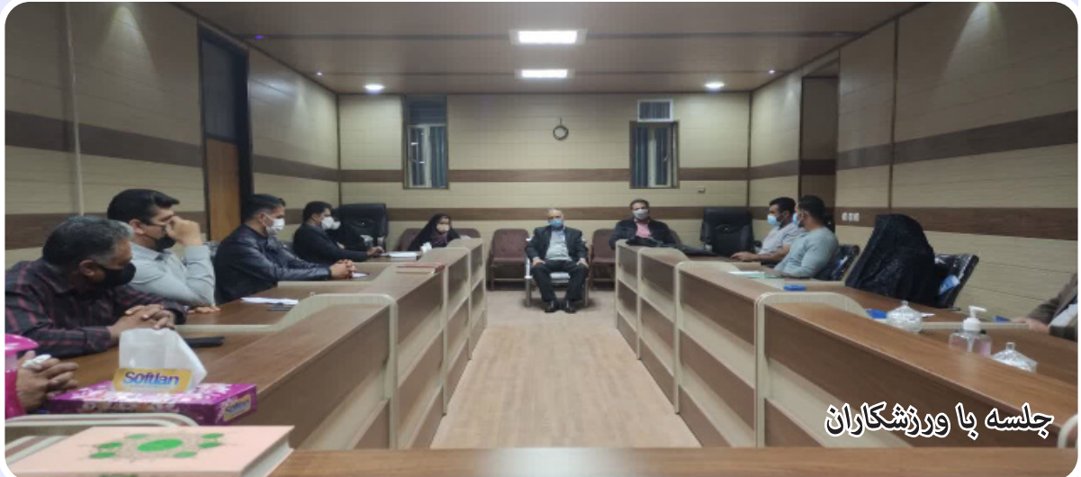
جلسه با ورزشکاران