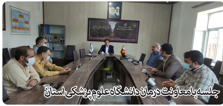
جلسه با معاونت درمان دانشگاه علوم پزشکی استان