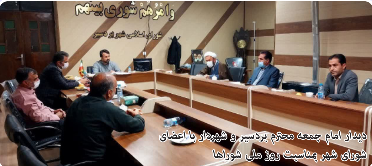
دیدار امام جمعه محترم بردسیر و شهردار با اعضای شورای اسلامی شهر بردسیر