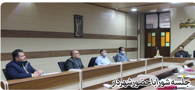
جلسه شورا با حضور شهردار