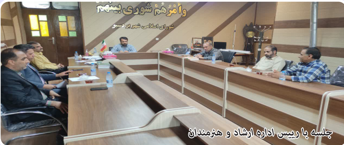
جلسه با رئیس اداره ارشاد و هنرمندان