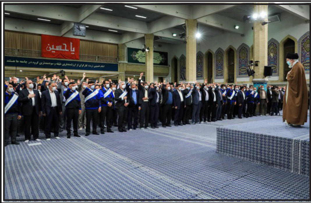
بیانات مقام معظم رهبری در دیدار بیش از هزار نفر از کارگران،

سپاس و ثنای بی حد بر خالق که به لطف استقرار مستحکم جمهوری اسلامی ایران و در راستای احترام و اکرام به شخصیت و هویت انسان و مردم عزیز ایران نهادی به نام شورای اسلامی در این کشور شکل گرفت. مشورت یکی از ارکان مهم سلامت تصمیم گیری هاست. بنا به فرمایش پیامبر اعظم (صلی الله علیه و آله) هیچ قومی مشورت نکردند جز آنکه به بهترین امور هدایت یافتند. نهاد شورا که شالوده آن ریشه در قرآن و مبانی دین مبین اسلام دارد در واقع به فرآیند واگذاری امور به مردم، عینیت بخشید و به برکت این اتفاق، نقش آفرینی مردم در تعیین سرنوشت خود و جامعه ای که در آن زندگی می کنند، دو چندان گردید. بی شک با بررسی عملکرد شورای اسلامی شهر از ابتدای تشکیل تا کنون شاهد ارتقای نمودار عملکرد شهرداری هادر عرصه های مختلف و تغییر چهره شهرها با استفاده از مشارکت و خرد جمعی بوده ایم و این سازمان مردمی روز به روز به هدف اصلی خود که بهره برداری از افکار مختلف و جذب همکاری شهروندان است. اینجانب این روز باشکوه رو به همه اعضای محترم شورای اسلامی شهر بردسیر که با وظیفه شناسی و توجه به اصل دانش محوری در حل مشکلات شهر تلاش می نمایند و با امانت، کفایت، درایت و کیاست و حسن سلوک برای نیل به جامعه ی شهروند مدار خالصانه و عاشقانه کوشش می نمایند تبریک و تهنیت عرض می نمایم. امیدوارم در نیل به برنامه های ارزشمندمان در پیشرفت روز افزون دیار مهرپرور کهن بردسیر به پشتوانه و دلگرمی مردم و همشهریان عزیزمان بتوانیم در مسیر توسعه و آبادانی گام برداریم.