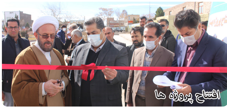
افتتاح پروژه ها