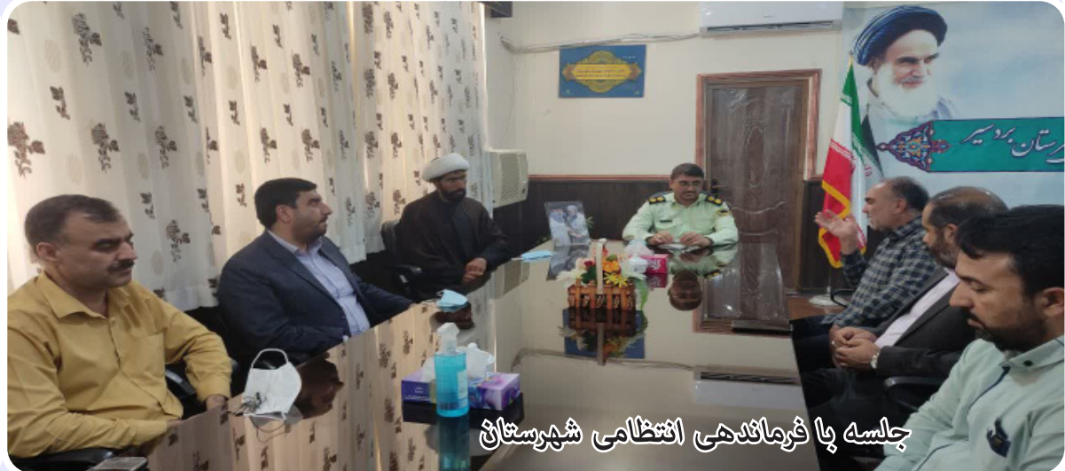
جلسه با فرماندهی انتظامی شهرستان