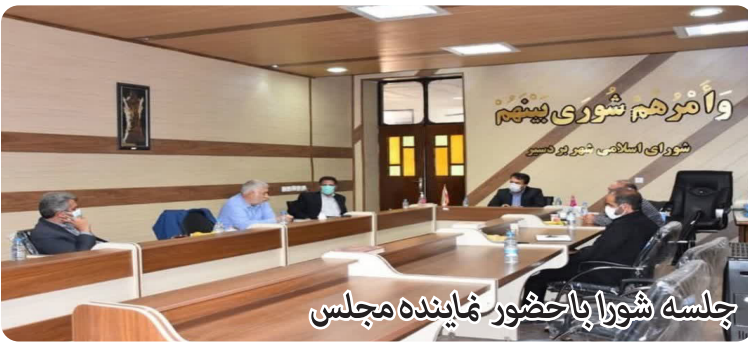
جلسه شورا با حضور نماینده مجلس