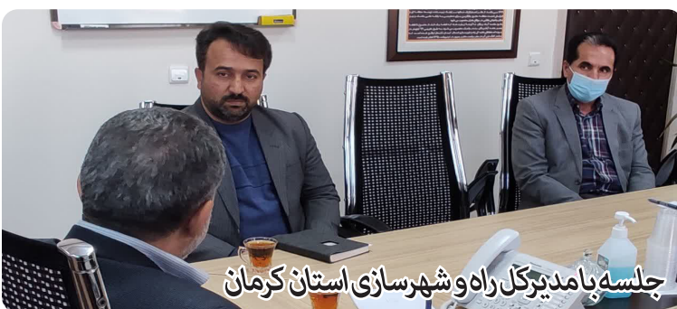
جلسه با مدیرکل راه و شهرسازی استان کرمان