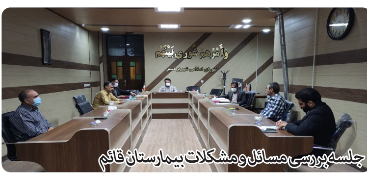
جلسه پرسش و پاسخ مسائل و مشکلات بیمارستان قائم