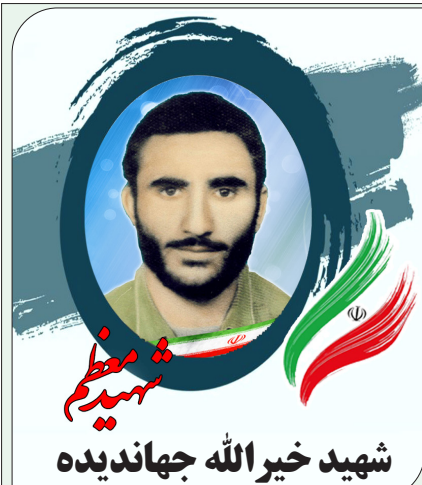
شهید خیر الله جهاندیده