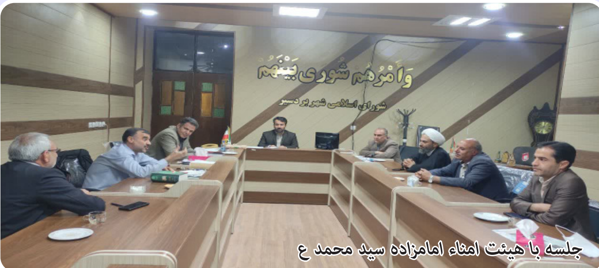
جلسه با هیئت امنا امامزاده سید محمد ع