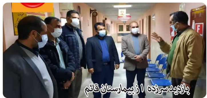
بازدید سرزده از بیمارستان قائم