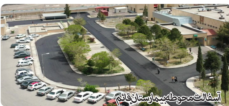
آسفالت محوطه بیمارستان قائم

۴- ممکن است در مورد سوابق کاری و تحصیلی خود کمی توضیح دهید؟ رشته تحصیلی بنده کارشناس ارشد مهندس عمران گرایش سازه و در حال حاضر شاغل در اداره راه و شهرسازی شهرستان بردسیر هستم و هم چنین سابقه ۱۲ سال تدریس رشته های عمران و معماری در دانشگاه آزاد اسلامی واحد بردسیر دارم و عضویت در جامعه اسلامی مهندسیین شهرستان بردسیر به عنوان دبیر جامعه - و عضو شورای مرکزی جامعه اسلامی مهندسیین استان کرمان و بازرس انجمن حمایت از زندانیان شهرستان بردسیر. بر روی جمع رهروان امر به معروف و نهی از منکر شهرستان بردسیر از دیگر مسئولیتهای اجتماعی من است ۵- یکی از اقدامات خوب شهرداری نهضت آسفالت معابر و کوچه ها بود شورا در این زمینه چکار کرده است؟ در نهضت آسفالت جمع زیرسازی و آسفالت ۲۵۸۰۰۰ متر مربع بوده که اقدامات خوبی در معابر و کوچه ها صورت گرفته ونسبت به تعویض و اصلاح معبر سطح شهر (جدول گذاری و موزائیک) و بنا بدرخواست شهرداری در شورا مصوب شد که ۲۶۰۰۰ متر طول جدولگذاری و ۲۵۰۰۰ متر مربع موزائیک شود که در حال اجراست.