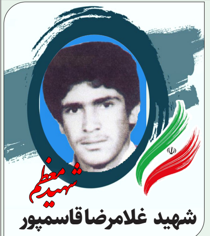
شهید غلامرضا قاسمپور

سال هزار و سیصد و چهل و دو، شهر نگار، بستر تولد یکی دیگر از سربازان امام خمینی(رحمته الله علیه) بود غلامرضا در دامان خانواده ای مهربان و زحمتکش پرورش یافت. پس از اتمام دوره ابتدائی، به بردسیر آمد تا با زندگی در اتاقی اجاره ای بتواند درس خود را ادامه دهد در مدت تحصیل همواره کمک حال پدر و مادر بود و از فرصت های پیش رو برای خدمت به والدین و اطرافیان استفاده می کرد. با شروع جنگ تحمیلی عراق علیه ایران، بخاطر وجود روحیه دلآوری که داشت در ایام تعطیل تابستان راهی جبهه شد پس از اخذ دیپلم در رشته بازرگانی، حدود دو ماه در بانک صادرات نگار به کارآموزی مشغول شد. با فرا رسیدن موعد سربازی، با وجود شرایط جنگی و نیاز کشور به بحث دفاع و نیروهای رزمنده، برای ثبت نام اقدام نمود و پس از گذراندن دوره آموزشی در زابل، برای انجام وظیفه به جبهه رفت. سرانجام پس از ماه ها خدمت، در تاریخ ۶۳/۴/۲۳ در شهر آبدان، با اصابت ترکش خمپاره، به مقام والای شهادت نائل آمد.