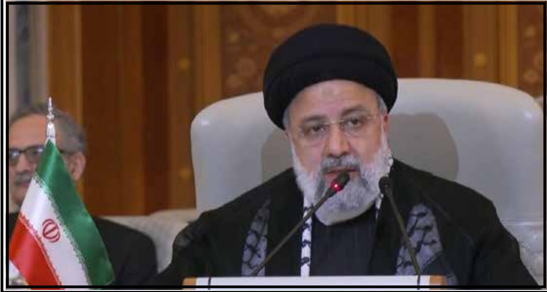
دکتر رئیسی در نشست اضطراری ریاض مطرح کرد؛

رئیس و دو سال نایب رئیس شورای شهر راور در دوره چهارم شوراهای اسلامی فرمانده پایگاه مقاومت فرمانداری بمدت ۱۷ سال رئیس مجمع بسیج و رئیس شورای قشر بسیج راور و مسئولیتهای دیگری در سمتهای سیاسی اجتماعی و فرهنگی در بخشهای مختلف عهده دار بوده است .