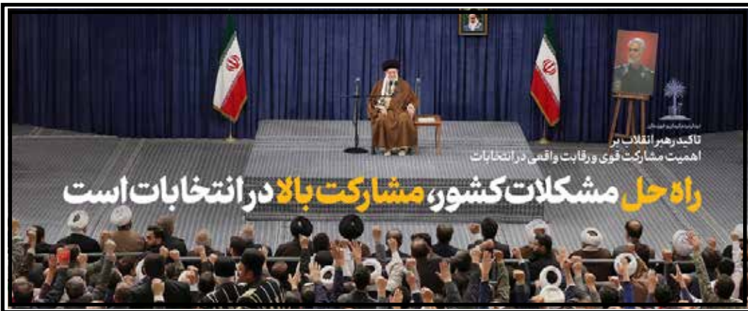
رهبر معظم انقلاب اسلامی در دیدار پرشور هزاران نفر از مردم پرافتخار استان‌های خوزستان و کرمان:

و متناسب با مأموریت‌ها و اقتضات هر دستگاه برای مدیران و مسئولان مربوط یکی از اقدامات مهم و مؤثر در پیشگیری از وقوع تخلفات و مفاسد اداری است و هیچ دستگاهی از نظارت مستثنی نیست. رئیسی تذکر و تنبه دادن به مدیران و مسئولان را نیز از دیگر اقدامات مهم پیشگیرانه دستگاه‌های نظارتی دانست که می‌تواند در مواقعی که مدیری به‌دلیل کثرت کار دچار غفلت شده است یا اشرف کفای روی مقررات ندارد، از وقوع تخلف یا فساد اداری جلوگیری کند. ایجاد ساختار و نظام‌مند شدن تبادل اطلاعات میان دستگاه‌های نظارتی و اهمیت هماهنگی در ارائه اخبار مصادیق مقابله با فساد و نه صرفاً اخبار قطعی نشده و غیردقیق از مفاسد نیز از دیگر تأکیدات وی به اعضای شورای هماهنگی دستگاه‌های نظارتی بود.