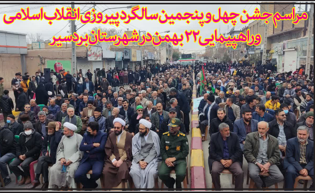
مراسم جشن چهل و پنجمین سالگرد پیروزی انقلاب اسلامی و راهپیمایی ۲۲ بهمن در شهرستان بردسیر