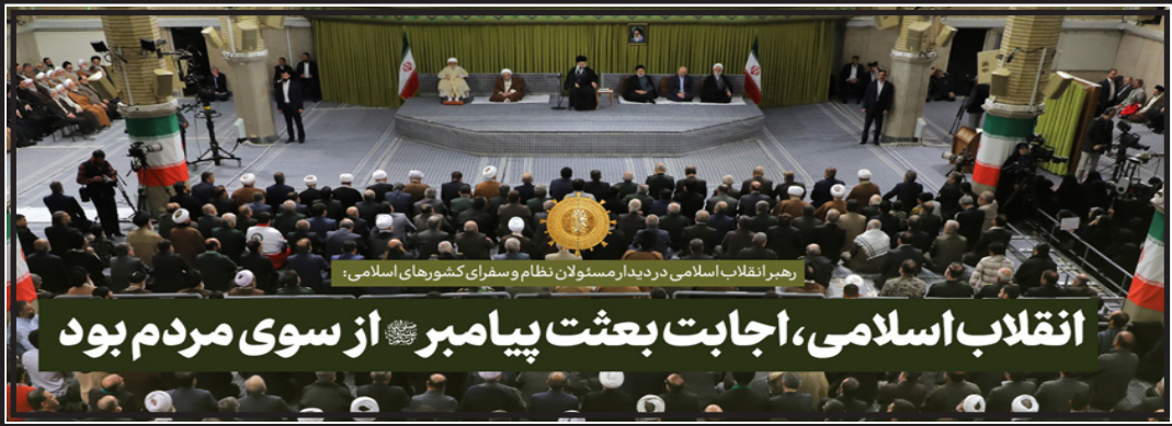
انقلاب اسلامی، اجابت بعثت پیامبر از سوی مردم بود

انقلاب اسلامی در بیست و دوم بهمن ماه هزار و سیصد و پنجاه و هفت با هدایت امام خمینی (ره) و همت مردم ایران به پیروزی رسید و نظام پادشاهی که مردم آن را به درستی ستمشاهی می‌نامیدند منقرض گردید و جمهوری اسلامی برپا شد. انقلاب را مردم با فداکاری و شهادت جوانان خود به پیروزی رساندند و مردی از جنس مردم را که در صداقت و پاکی و روشن بینی و دلسوزی او برای ملت تردیدی نداشتند به رهبری خود برگزیدند. انقلاب اسلامی از نخستین روز پیروزی به همان اندازه که نزد مردم ایران عزیز و دوست‌داشتنی بود در چشم آمریکا و انگلیس و دیگر کشورهای سلطه‌گر و اذنب منطفه‌ای آنها منفی و مایوس‌کننده و مزاحم تلقی می‌شد. و برای مقابله گسترش و توسعه انقلاب اسلامی از هر کاری که در توان داشتند بهره بردند مثل اختلافات قومی، جنگ تحمیلی، تحریم‌های متوالی، ترور شخصیتها، انحراف افکار عمومی، کمک به گروه‌های معاند و اپوزسیون برای براندازی نظام مقتدر جمهوری اسلامی ایران که به لطف و عنایت خداوند متعال، ایران اسلامی مقتدر و قوی بسوی پیشرفت در همه زمینه‌های علمی و صنعتی، نظامی و دفاعی، هوا فضا و... گام برداشته و به سطوح کشورهای برتر جهان دست یافته است که این پیشرفت‌ها بیشتر باعث حسادت و تحیر و تعجب و ناباوری آنها گردیده است لذا در سالهای اخیر با شکستهای پی‌درپی، تهاجم‌های فرهنگی تدارک جنگ ترکیبی گسترده رسانه‌ای او... را سرعت بخشید.