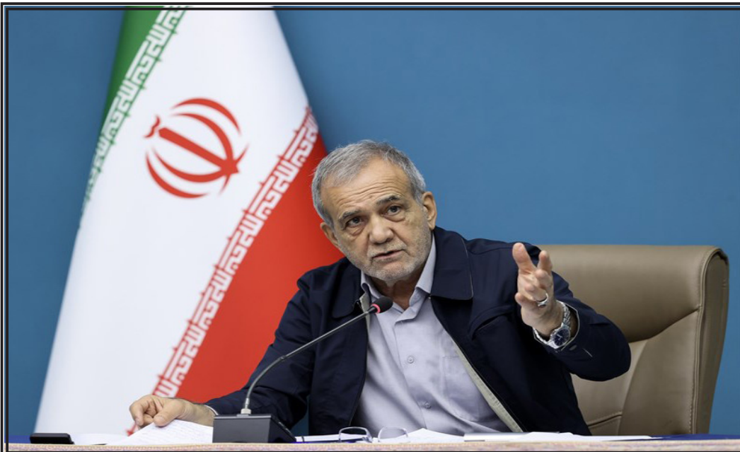
رئیس جمهور در نشست ستاد اربعین:

وی افزود: رسانه قدرت فرهنگ سازی دارد امروز محور اصلی تغییر و تحولات قدرت رسانه است و استفاده فوق العاده ای از رسانه در موضوعات مختلف میشود چون رسانه وسیله ارتباط بین مردم است و در همه زمانها به شکلی وجود داشته در گذشته قدرت رسانه بود که حادثه کربلا را ایجاد کرد و در روز عاشورا بواسطه همین تبلیغات سوء عنده کثیری مسلمان و نمازخوان، در مقابل امام ایستادند و در شام آن زمان با خلافت ۶۰ ساله معاویه که باعث سب امام علی علیه السلام در منابر می شد وقتی خبر شهادت امام علی علیه السلام منتشر شد که در مسجد به شهادت رسیده