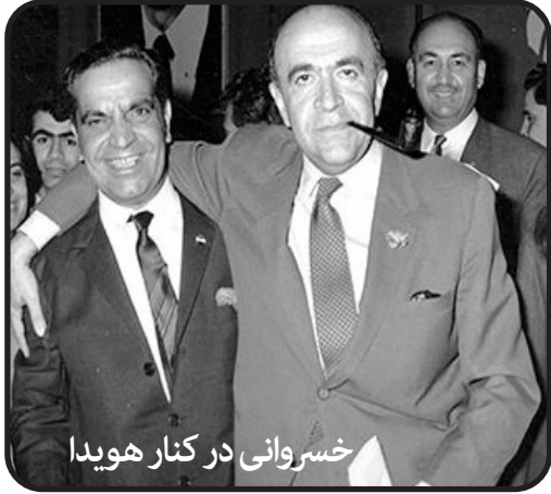
خسروانی در کنار هویدا

جریان حوادث منجر به کودتای ۲۸ مرداد۱۳۳۲ به خوبی حس کرده بود، علاوه بر بحران اقتصادی فراگیر در کشور، احتمال خطر دربار را نیز گوشزد می کرد و با راهنمایی و ارشاد حامی قدرتمند خود یعنی آمریکا تصمیم گرفت دست به انجام اصلاحات بزند. آمریکا از رژیم وابسته به خود می خواست که دست به تحول فربکارانه بزند و اصلاحاتی را شروع کند که توده های کارگر و دهقان راضی شوند؛ آنها را سرگرم سازد و شعارهای کاذب را رواج دهند. این شعارها در حدود زمین برای دهقانان و آسایش و رفاه برای کارگران باشد تا از قهر انقلابی جلوگیری کند.