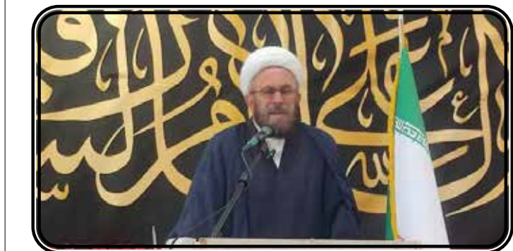
حجت الاسلام والمسلمین کرماتی