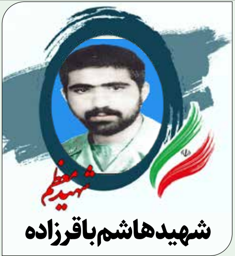
شهید هاشم باقرزاده