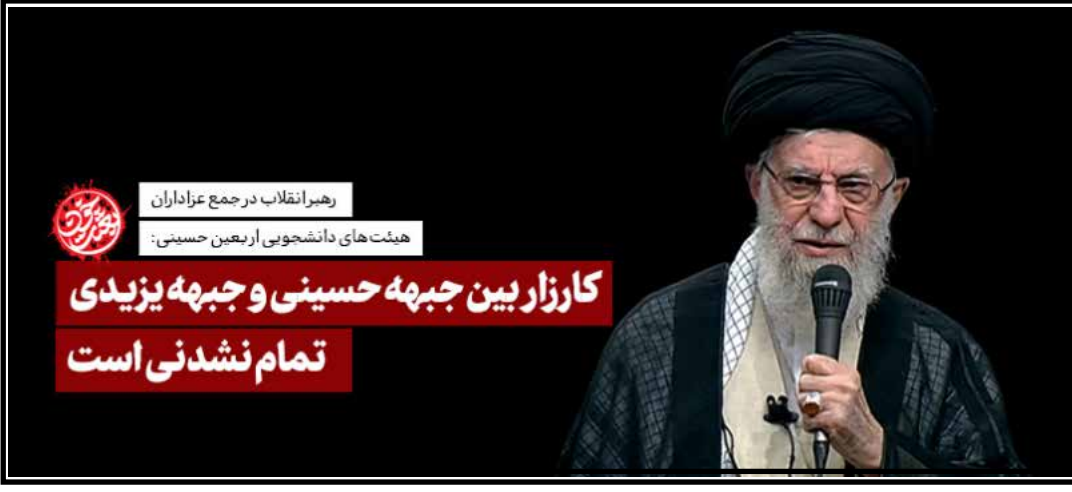
رهبرانقلاب در جمع عزاداران هیئت‌های دانشجویی اربعین حسینی: کارزار بین جبهه حسینی و جبهه یزیدی تمام نشدنی است

بیانات مقام معظم رهبری در مراسم عزاداری دانشجویان به مناسبت اربعین حسینی؛ صفحه ۳ کارزار جبهه حسینی با جبهه یزیدی تمام نشدنی است