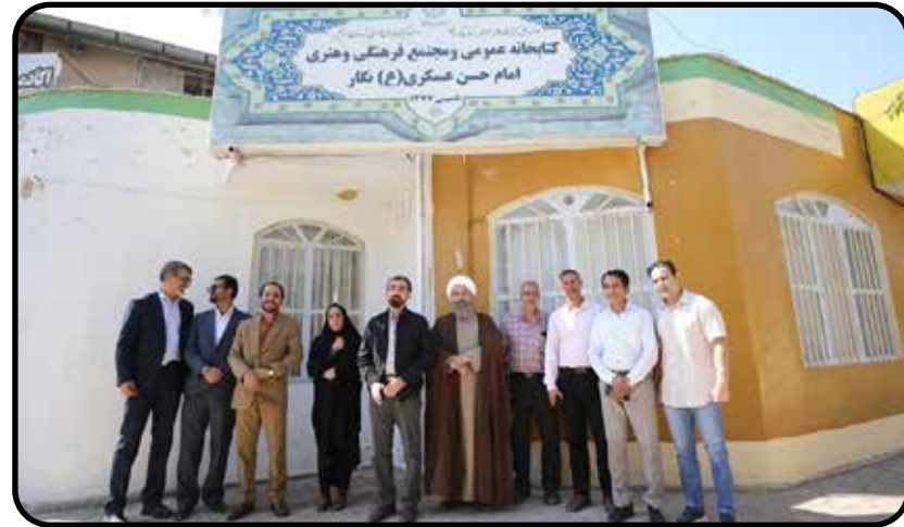
فضای فیزیکی کتابخانه مرکزی توسعه دوبرابری داشته است

دبیرکل نهاد کتابخانه‌های عمومی کشور اظهار داشت: البته در سخت افزار هم ما وظایفمان را انجام می دهیم و میز و صندلی های فرسوده و کهنه را تعویض و به غنی سازی کتابها و کتابخانه ها کمک خواهیم کرد.