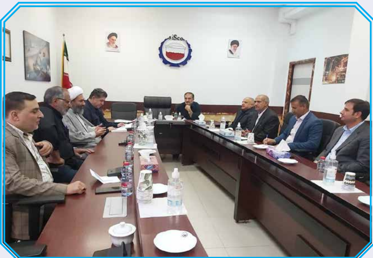
دیدار اعضای شورای شهر نگار، بخشدار، شهردار با مدیرعامل شرکت فولاد سیرجان ایرانیان