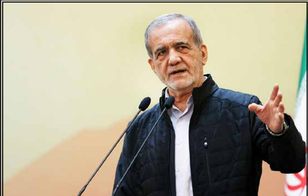
رئیس‌جمهور به مناسبت روز دانشجو در جمع دانشجویان دانشگاه صنعتی شریف: